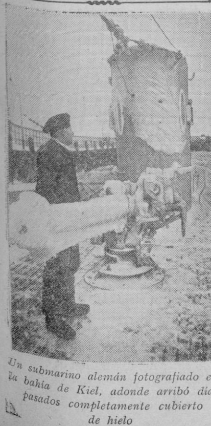
Un submarino alemán fotografiado en la bahía de Kiel, adonde arribó días pasados completamente cubierto de hielo

En breve daremos nuevos detalles de este importante acto público.