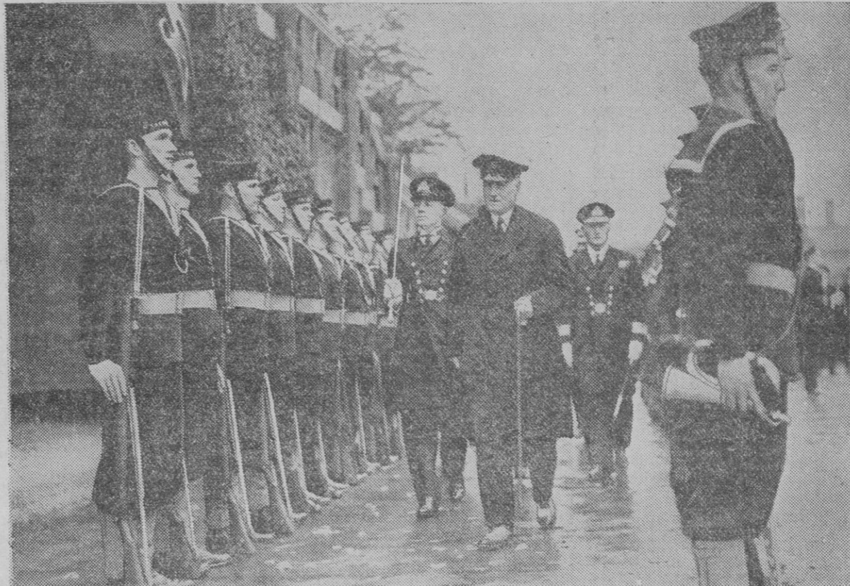
En la Cámara de los Comunes se desarrolló un debate hace unos días a propósito de haber sido sancionados varios empleados de los arsenales británicos, como consecuencia de los actos de sabotajes cometidos en la Marina inglesa. Las revelaciones hechas por el ministro Samuel Hoare causaron sensación. La foto recoge el momento en que Mr. Hoare, ministro de Marina, pasa revista de inspección a los marinos de la estación naval de Chatham, una de las plazas donde se han cometido actos de sabotaje contra los buques de guerra.