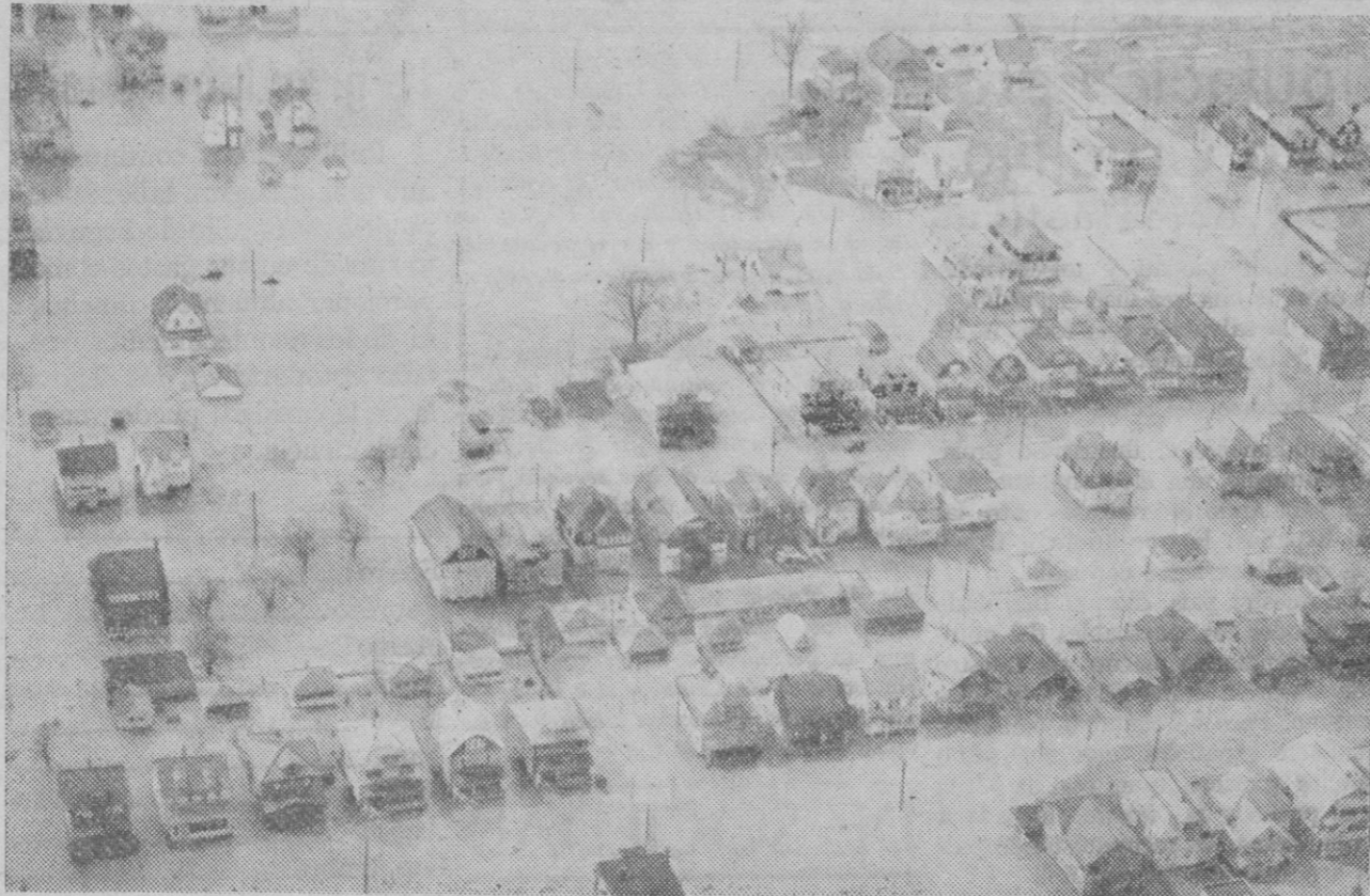
Una ciudad de la América Oriental afectada por las inundaciones a consecuencia del desbordamiento de los ríos Ohio y Mississippi (Fotografía obtenida desde un avión)