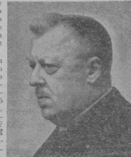
El doctor Echener, que ha sido relevado del mando de los zepelines por negarse a emitir opinión acerca del reciente plebiscito y de la ocupación de Renania