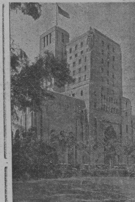
Las estrellas en Hollywood poseen un club donde se reúnen. La ilustración presenta al edificio en donde el club tiene sus localidades