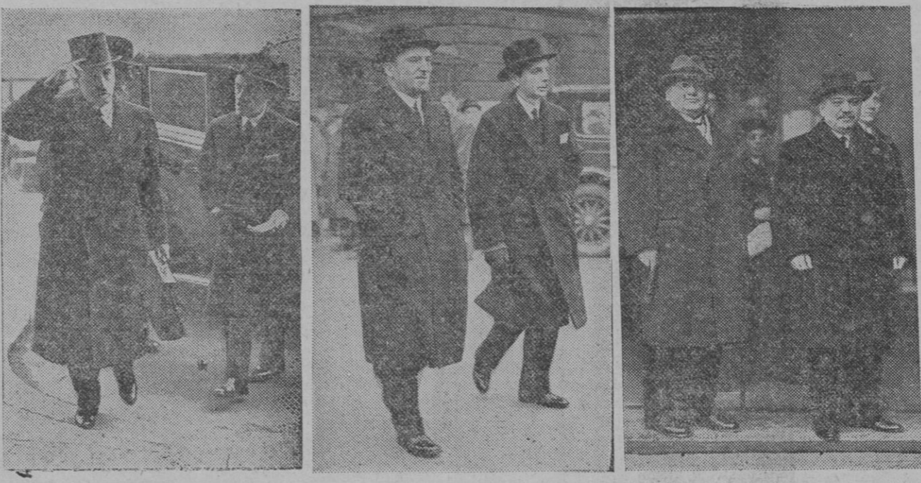
(De izquierda a derecha). Van Zeeland, primer ministro de Bélgica; Grandi, embajador de Italia en Londres, y Litvinoff, comisario ruso de Negocios Extranjeros, acompañados del embajador en Londres señor Maisky, llegan al palacio de St. James para tomar parte en las reuniones del Consejo de la Sociedad de Naciones

Llegada de delegados al Palacio de St. James