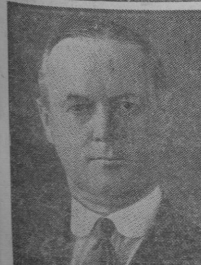
El nuevo ministro de Defensa Nacional en Inglaterra sir Thomas Inskip

Todos los pastos y prados de España, presentan magnífico aspecto, lo que hace poder calificar al año de muy bueno para la ganadería.