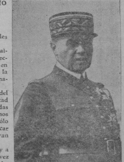
El general Gamelin, comandante en jefe del Ejército francés

El Gobierno de la República aplica y aplicará la ley a quienes persistan en tan antipatriótica actitud, a la vez que confía en que la serenidad de sus soldados, en todas las categorías, han de hacerles menospreciar cualquier hecho en que, con abuso de la credulidad de las masas, sólo se busque provocar mayores males.»