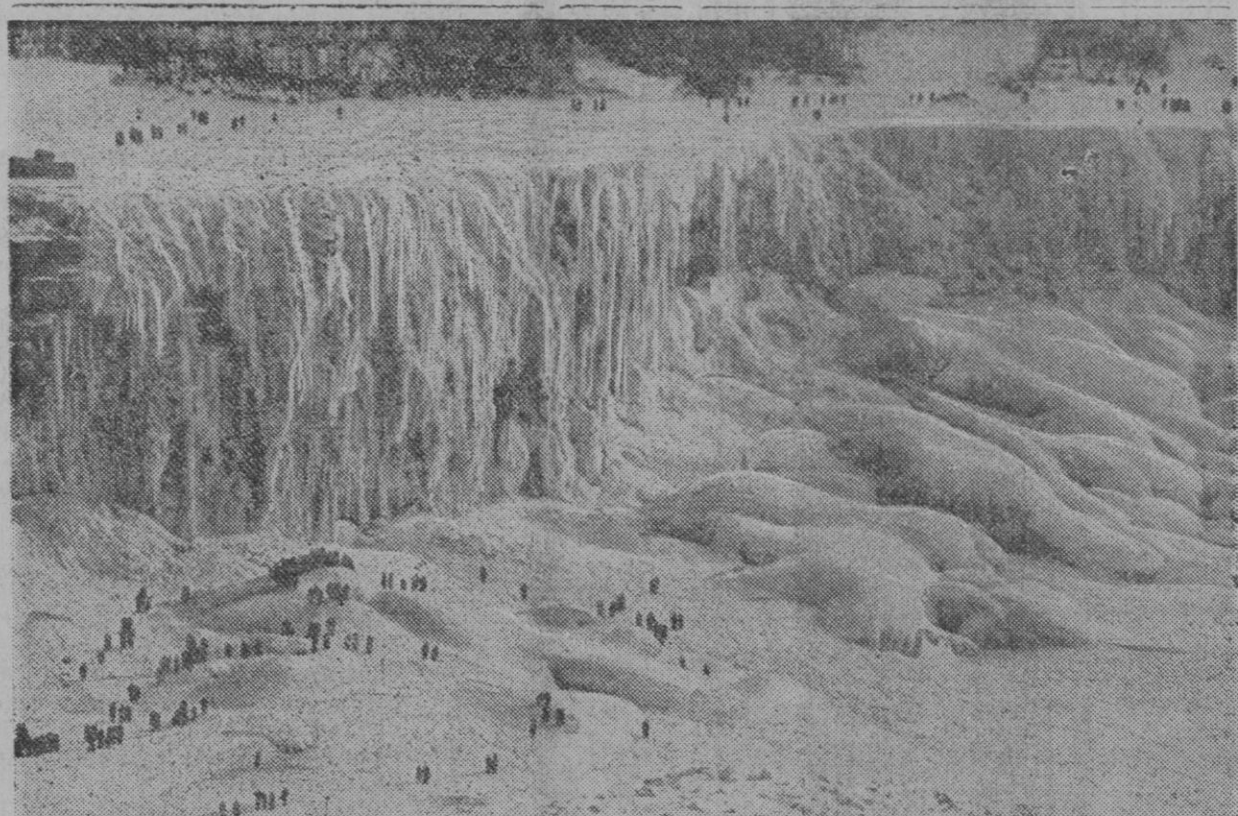
He aquí al gigantesco salto de agua de las cataratas del Niágara, helado a consecuencia de la temperatura glacial que estos días se deja sentir en aquella parte de los Estados Unidos. Tan grandioso espectáculo está siendo visitadísimo por innumerables turistas, a muchos de los cuales se les ve en esta fotografía

Habana, 25 (2 t.).—El conde de Covadonga duerme desde media noche. Los médicos no han facilitado