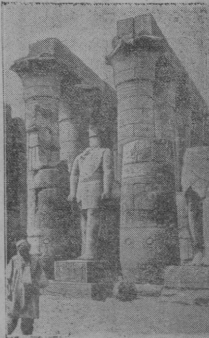
En Luxor (Egipto), donde anteriormente se han encontrado objetos de arte antiguo preciosos, una expedición americana ha hallado dos tumbas, cuya apertura es esperada con gran interés

Los objetos para este baile están expuestos en el escaparate del señor La Orden