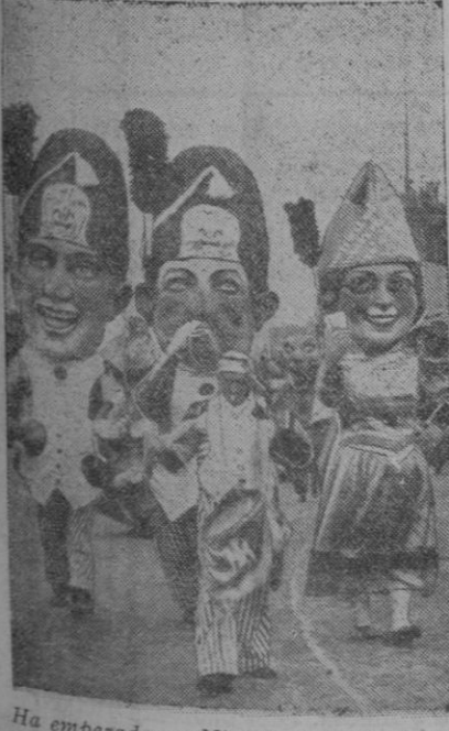
Ha empezado en Niza la temporada de Carnaval. Nuestra ilustración representa una de las comparsas tradicionales que circulan por las calles de la capital, entre la alegría del vecindario de ésta y de los turistas