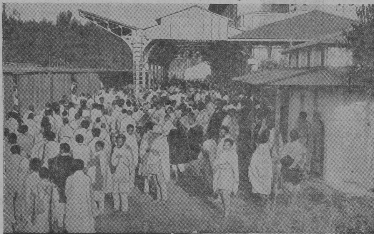
Los guerreros etíopes en la estación férrea de Addis Abeba