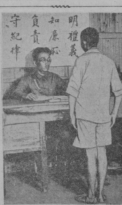
En muchas ciudades chinas se recluta ahora un gran número de hombres para el Ejército, a fin de que éste pueda estar preparado para una guerra preventiva. La ilustración representa el interior de una oficina de reclutamiento