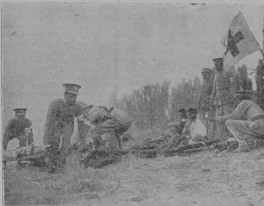
Soldados de la Cruz Roja abisinia en funciones