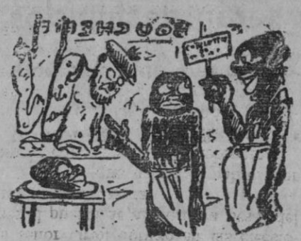
CARNIGERIA ANTRÓPOFAGICA. El chico.—¿Qué etiqueta pongo a ese cuarto de mariner? El patrón.—Costillas de puerto.

Recuerda el señor MAEZTU que el señor Aguirre recordó que los vascos han luchado por España en muchos momentos históricos.