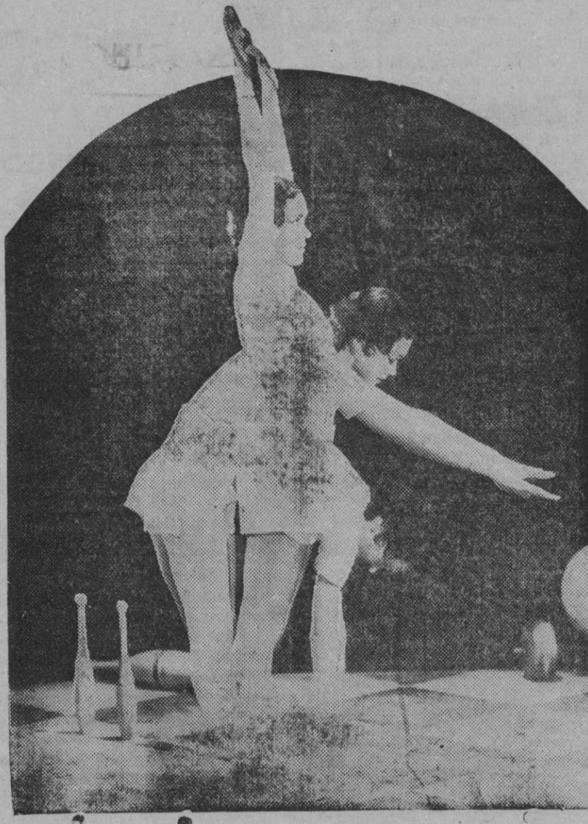
Mauren O'Sullivan, notable personaje de Cinelandia, se desayuna cotidianamente con una sesión de gimnasia que practica escuchando la radio o algún disco fonográfico. De esa manera conserva la belleza de su silueta escultural eternamente joven. Recomendamos el procedimiento, previa selección del programa sonoro