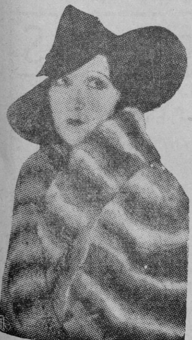
La moda femenina en la presente temporada invernal