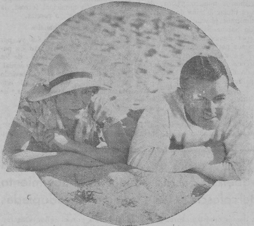
Richard Barthelme, el famoso actor cinematográfico y su esposa, descansando sobre la arena de una playa californiana.

Gran verdad que disgustó a algún compañero del que vertió la especie y de todos los cuadros republicanos. ¿Qué culpa tiene nadie de que sea así y de que los únicos que caminen seguros de sus intenciones sean los marxistas, contra quienes se revuelven ahora muchos de sus antes complacientes colaboradores?