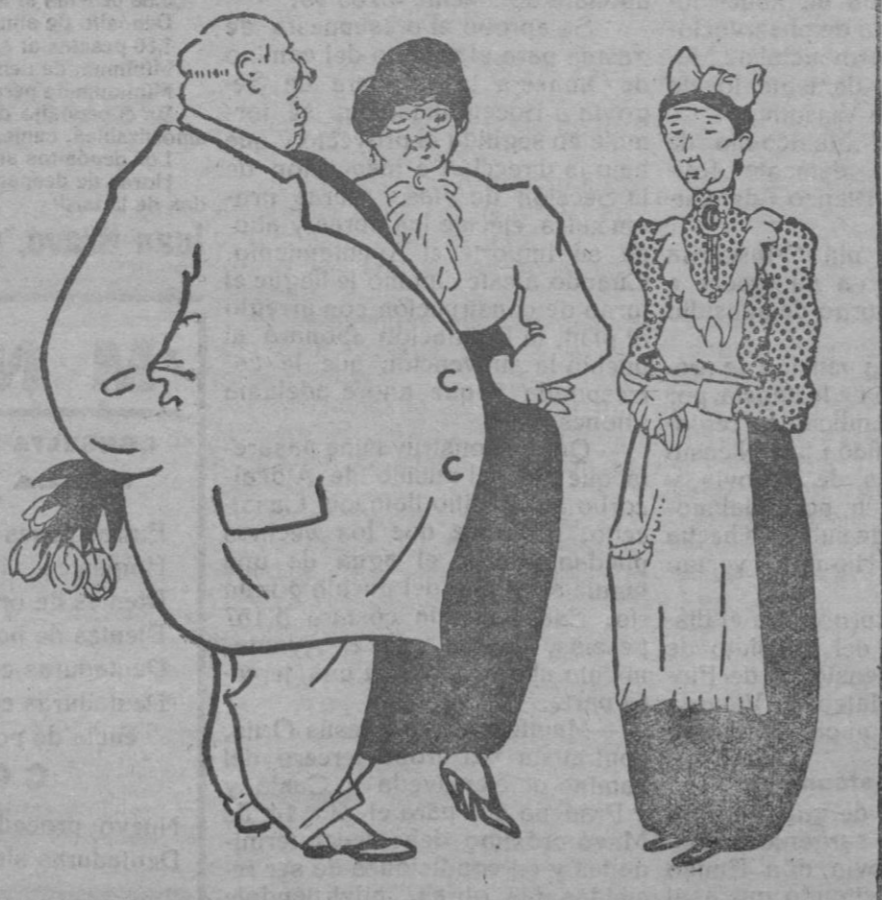
—Llevas ya veinte años a nuestro servicio y ha llegado la hora de que te consideremos como de la familia: desde el mes que viene no te daremos sueldo.

el más grato recuerdo, y es prueba de la compenetración entre Francia y España, que tantos beneficios reportará a ambos países.»