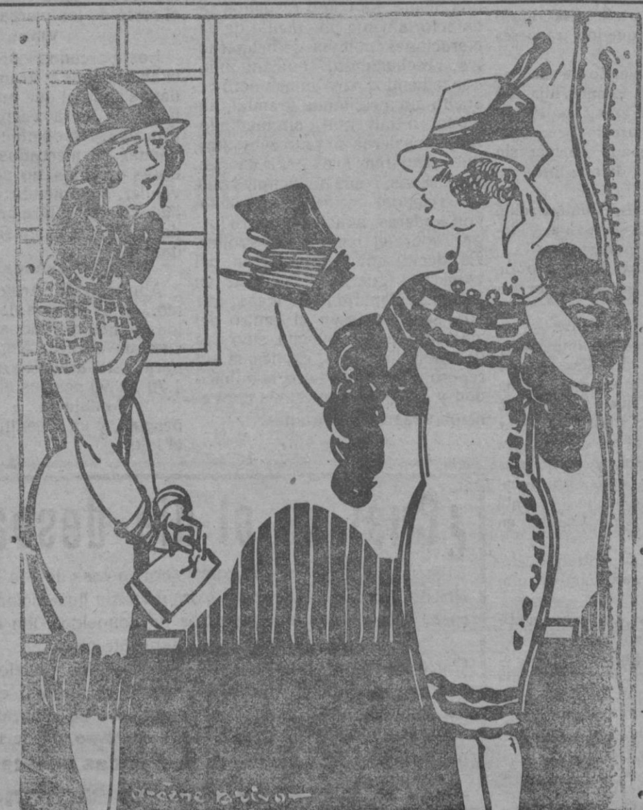
—¿Te pintas con carmín? —¡Qué! Me pinto sola.