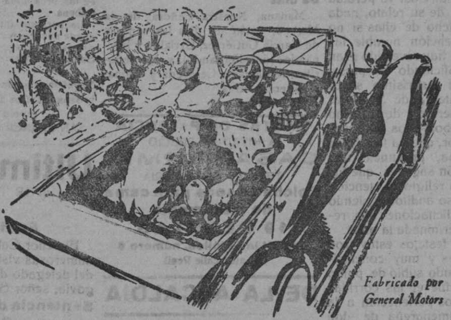
Fabricado por General Motors

NUNCA se ha conocido tanta belleza, tan buena calidad ni tan intachable acabado por tan poco precio. Todo lo que muchos coches de lujo pueden ofrecerle lo tiene usted en el Chevrolet.