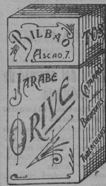
El mejor remedio para el peor caso de... ro, JARABE ORIVE

Sociedad Española NUTREINA, calle del Cardenal Cisneros, núm. 62, MADRID