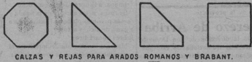
CALZAS Y REJAS PARA ARADOS ROMANOS Y BRABANT.