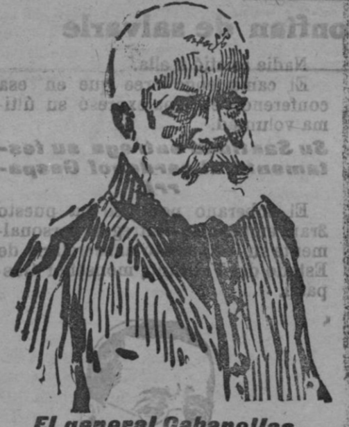
El general Cabanellas, que con gran acierto dirige la acción de la caballería en Marruecos