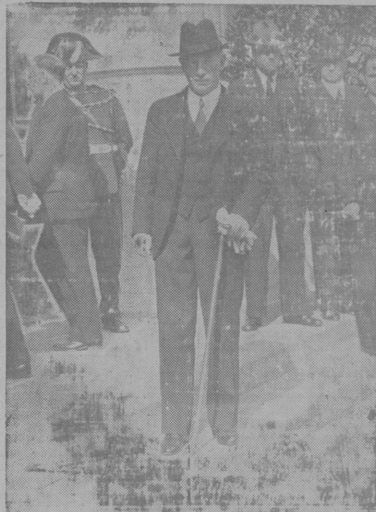
LA ASAMBLEA DE LA LIGA DE NACIONES.—El Sr. Benes, Ministro Checoslovaco, elegido presidente de la asamblea.

Se dice que el 23 del actual aparecerán los decretos sobre restricciones y el reajuste ministerial sin crisis.