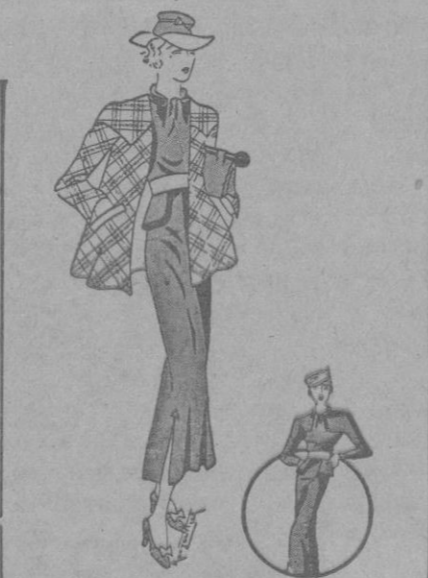
Vestido para el día en lanilla azul cinturón de cuero blanco y chaqueta de lana con colores lineales.

Algunas modelos aparecen intermedias entre la camisa de noche y el «deshabillé»; cortados en tela de seda de bastante cuerpo provistos de largas y voluminosas mangas, fruncidas en su parte superior y en las muñecas, son «deshabillés» de cama de magnífica línea, cuyo sello de