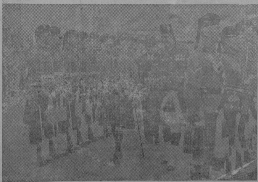
EL REY DE INGLATERRA EN ESCOCIA.—El soberano inglés revistando su guardia de honor llamada «La Guardia Negra» a su llegada a Ballater, donde está situado el castillo de Balmoral, en el que pasará unas semanas.

No se devuelven los originales ni se sostiene correspondencia respecto a la colaboración solicitada.