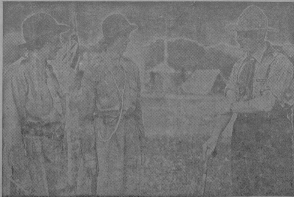
EL REY CAROL Y LOS SCOUTS FEMENIOS.—El Rey Carol de Rumania en la reunión anual de los Scouts femeninos del mundo entero, en Breaza cerca de Prahava (Rumania), charlando con dos girls guías inglesas.