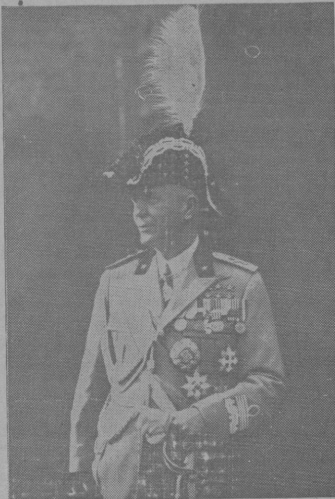
GENERAL ITALIANO CONDECORADO.—El Jefe del Estado Mayor de Italia, General Badoglio que ha recibido el Gran Cordón de la Legión de Honor, la más alta distinción de Francia.

Antes que el zumbido de los motores de explosión se dejesen oír a lo largo de nuestras playas, las parejas del bou a la vela, extrañan del mar su codiciado pro-