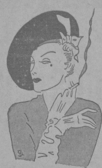
Elegante modelo de sombrero en paja negra, muy de moda actualmente.