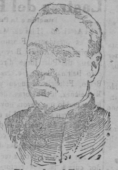
El cardenal Ferrari,

que se halla gravemente enfermo y que se teme un rápido y funesto desenlace.