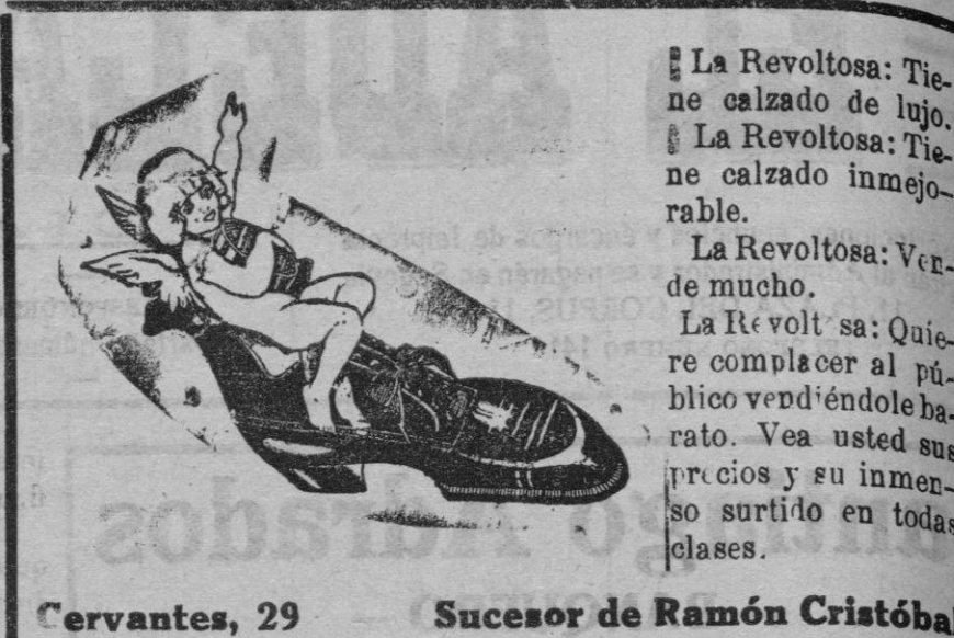
Cervantes, 29 Sucesor de Ramón Cristóbal

Es muy significativo, en punto a la situación financiera, el hecho de que acaban de emitir 5 000 millones de rublos papel, cuando hasta la fecha se habían emitido ya unos 3,500 millones.