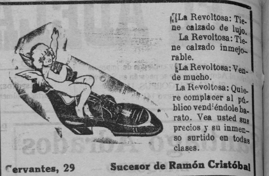
Cervantes, 29 Sucesor de Ramón Cristóbal

ordenaba a diario numerosas detenciones, amén de no pocos fusilamientos.