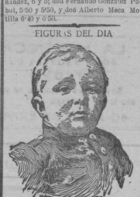
El príncipe de Asturias, que ha jurado la bandera como soldado del regimiento Inmemorial del Rey.