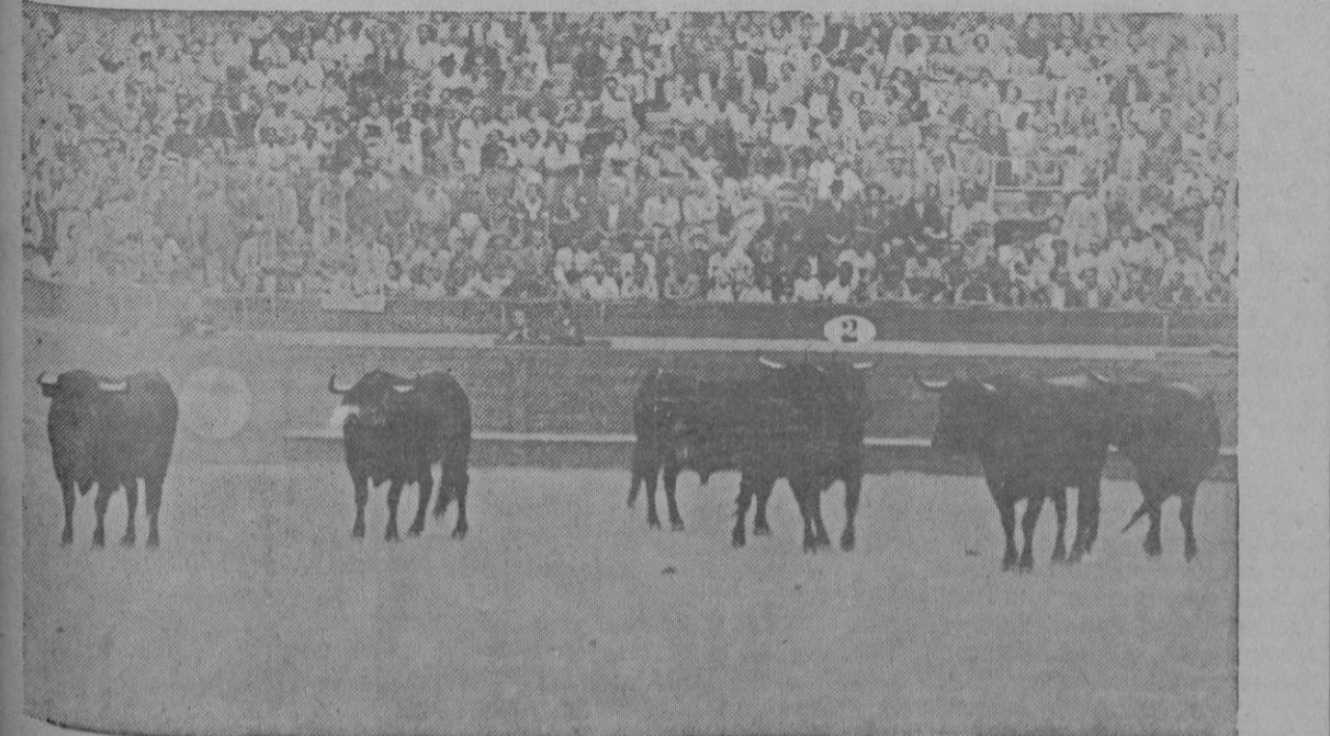
... es el corral de Ales que ha de lidiarse el domingo, en la corrida de Feria. Seis toros parejos, de magnífico trapío, bien encornados y enmorrillados, cuya presentación ha colmado todas las exigencias.

claro está que pudieran simpliarse muchos aspectos de la educación y a eso tiende el mundo moderno, pero se corre el peligro de perder lo bueno y quedarse con lo malo. Precisa un gran tacto en esto, pero quienes dan las normas, conocen siempre el buen camino. Está bien no sacrificarse tanto la comodidad a la educación, pero no se ha de llegar a los pies sobre la mesa de los norteamericanos. Pueblo no quiere decir ordinario y no se ha de exaltar ésta para adularle. Observando al pueblo en sus danzas se advierte su amplio sentido de aristocracia y distinción, lo mismo que cuando siente y cuando lucha. A los mejores de entre el pueblo, (la aristocracia en su amplio sentido) es a quienes hay que exaltar; con ellos están las normas de lo democrático. No es lo mismo popular que plebeyo; esta última palabra está al otro extremo de la otra, en la parte baja. Vayamos siempre a lo popular que pide justicia y huyamos del honor de la plebeyez, desarrapada e impotente que pide la igualdad del fango.