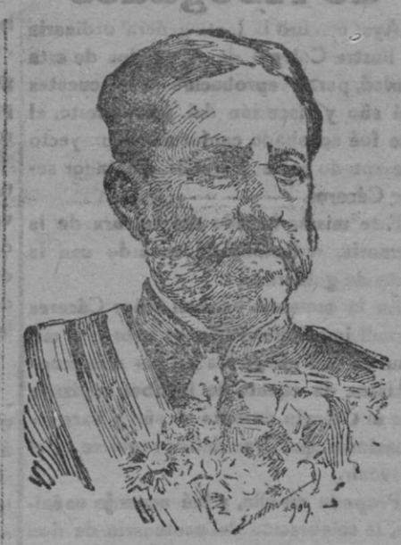
General don Valeriano Weyler y Nicolau

que por su dimisión de la Capitanía general de Cataluña ha sido sustituido por el general Weyler