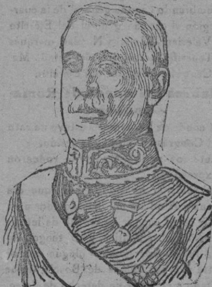
El marqués de Grijal, gobernador de Madrid, que con gran acierto solucionó las cuestiones obreras, siendo muy felicitado por ello.