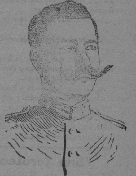
El general Fernández Silvestre, que ha sido nombrado comandante general de Ceuta.