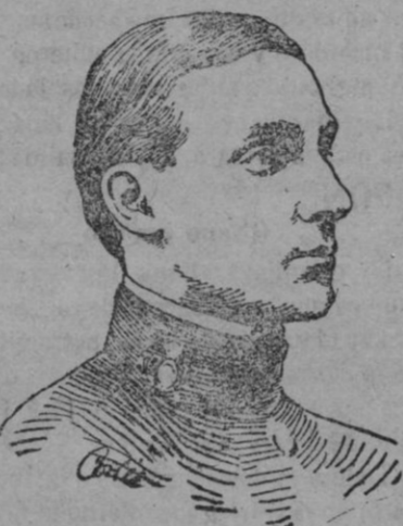
El infante D. Alfonso de Orleans, que ha sufrido un grave accidente de «skis», en Brunen (Suiza)