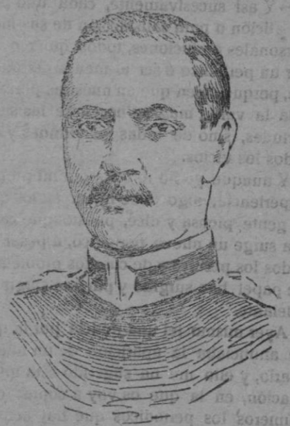
GENERAL MILNE, comandante de las fuerzas británicas en Oriente.