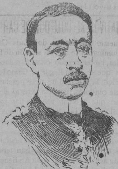
VICEALMIRANTE DEL BONO, nuevo ministro de Marina de Italia.