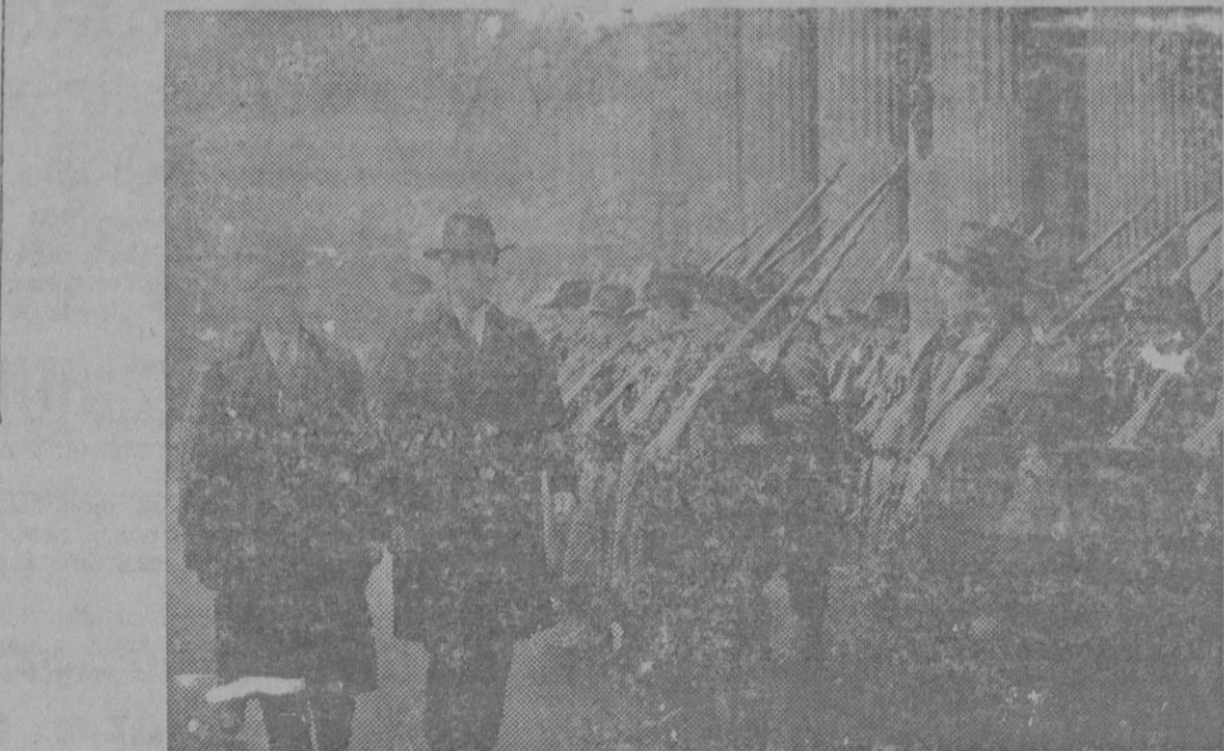
El 19.º ANIVERSARIO DE LA REVOLUCION IRLANDESA.—Con gran ceremonia se celebró en Dublin el 19.º aniversario de la revolución para la libertad de Irlanda de 1916, que tuvo lugar en los días de Pascua. El Presidente De Valera pasando revista de los antiguos combatientes de la revolución: muchos vistieron su viejo uniforme para celebrar la fiesta.

Zanzibar 8.—El famoso aviador alemán Karl Schwabe, durante su tercer vuelo africano, fué sorprendido por las lluvias del monzón, entre Zanzibar y Mc bassa.