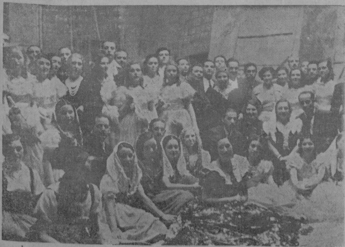
LA REPRESENTACION BENEFICA DE «LUISA FERNANDA».—Grupo de intérpretes «amateurs» de nuestra buena sociedad, que actuaron en las representaciones de «Luisa Fernanda», con tanto éxito celebrados.

El dilema planteado hoy a la Gran Bretaña fué claramente expuesto en la Cámara por Mac Donald; o se establecerá—dijo—una inteligencia general por libre negociación o consentimiento mútuo; o habrá que recurrir a la fuerza y establecer contra la guerra una valla de bayonetas de carne humana que siempre fué derribada. Y si se resuelva rearmar Inglaterra en submarinos y aviones, es por que se necesita estar prepara-