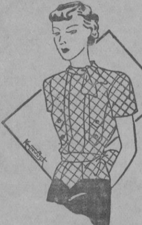
Blusa de seda lavable de muy elegante corte con cuello anudado y cintura de igual procedimiento. Muy propio para la época veraniega.

Los errores que se cometen en el tratado de la belleza