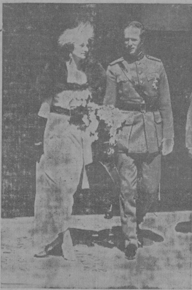
INAUGURACION DE LA SECCION BELGA DE LA EXPOSICION INTERNACIONAL DE BRUSELAS.—Los soberanos belgas inauguraron ayer por la mañana los pavellones de la sección belga de la Exposición Internacional de Bruselas. Los soberanos a su llegada a la Exposición.

No se devuelven los originales ni se sostiene correspondencia respecto a la colaboración no solicitada.