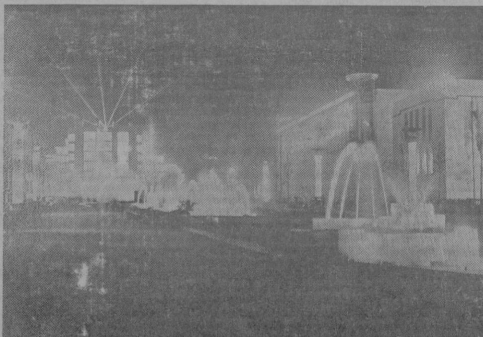
LA EXPOSICION INTERNACIONAL DE BRUSELAS.—Un verdadero país de hadas se ofrece a los ojos de los visitantes que se apresuran a visitar la Exposición Internacional de Bruselas. Sobre todo por la noche los efectos de las iluminaciones ofrecen un espectáculo maravilloso.