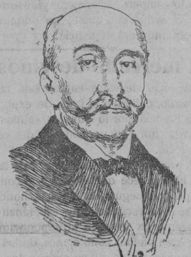
SR. VIZCONDE DE MATAMALA, Nuevo ministro de la Gobernación.