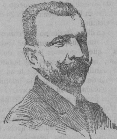
DON AMALIO GIMENO, Nuevo ministro de Marina.