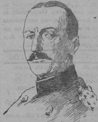
GENERAL VON STEIM

comandante del ejército alemán que cubre el sector de Verdun.