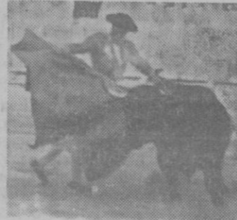
«EL INDIO» EN EL TERCERO

El primer toro llevó un puyazo de exceso y el segundo, contrariamente, pasó a banderillas con uno o dos puyazos de menos. No cabe en estos casos invocar la letra del reglamento, pues por encima de ella está su espíritu, que la Presidencia debe interpretar. El que un toro se «pase» de castigo tiene alguna disculpa: pero no lo segundo, que además entraña un serio peligro para el lidiador. Como hemos dicho, el segundo toro pasó sin castigo a banderillas y llegó entero, sin abrir la boca, a la muleta. Haciendo que el toro llevara un par más de los reglamentarios, se hubiese podido subsanar el error. La Presidencia no supo apreciarlo. Se me ha dicho que desde el palco presidencial, debido a su distancia del ruedo, no puede distinguirse bien si los toros han sido suficientemente picados. Yo me limitaré a preguntar: ¿Puede presidirse una corrida a ciegas, cam-