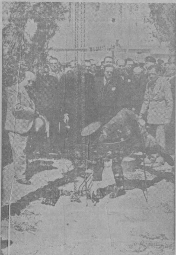
EL GRUPO ESCOLAR «JAIME I».—Momento de la colocación de la primera piedra por el Comandante Militar de Baleares, General Goded.