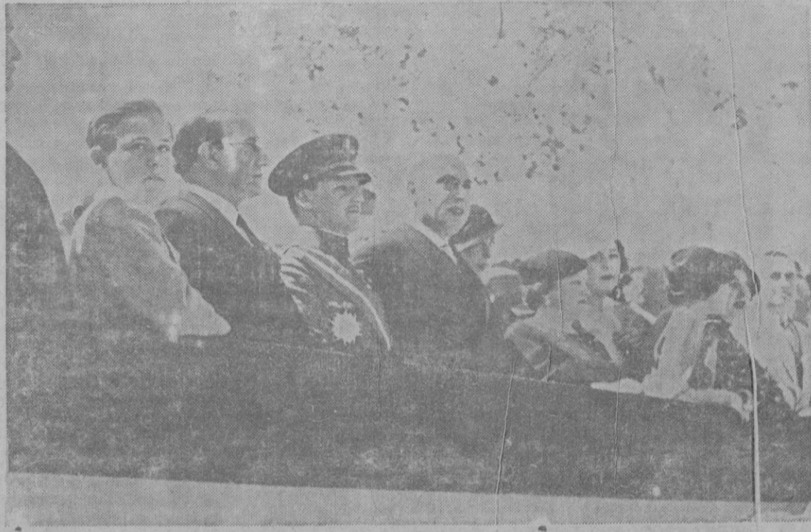
LA TRIBUNA DE AUTORIDADES