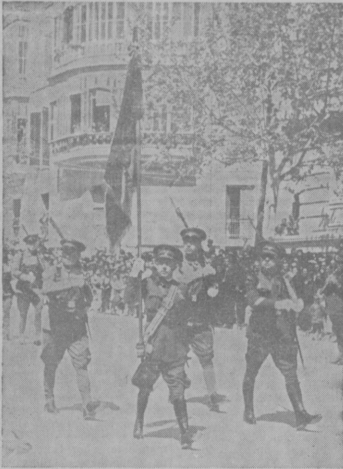
Otro interesante momento del desfile militar: El paso ante la tribuna de Autoridades de la enseña de la Patria.

Hay que reconocer que la bravata actualmente se considera como un procedimiento especial de la diplomacia audaz, así cuando el Japón se propuso establecer en la Mandchuria un gobierno feudal del suyo, lo precedió de maniobras de aproximación. Tanteó el terreno y se arriesgó a poner la S. de N. frente a hechos consumados de orden secundario como la ocupación de Mukden, y esperó las reacciones. Y al ver que eran insignificantes, abusando de su audacia desembarcó en Shanghai punto sensible de los intereses europeos sus divisiones. Al no ser sancionado procedió metódicamente, ya entonces a la ocupación completa del Manchoukouo, Jehol y los confines de Mongolia. El ejemplo ha dado sus frutos, en