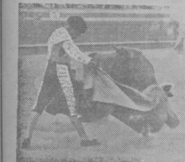
LA CAL EN EL PRIMERO

Todo lo anterior se compagina perfectamente con lo que he venido diciendo de Pericás desde sus pri-