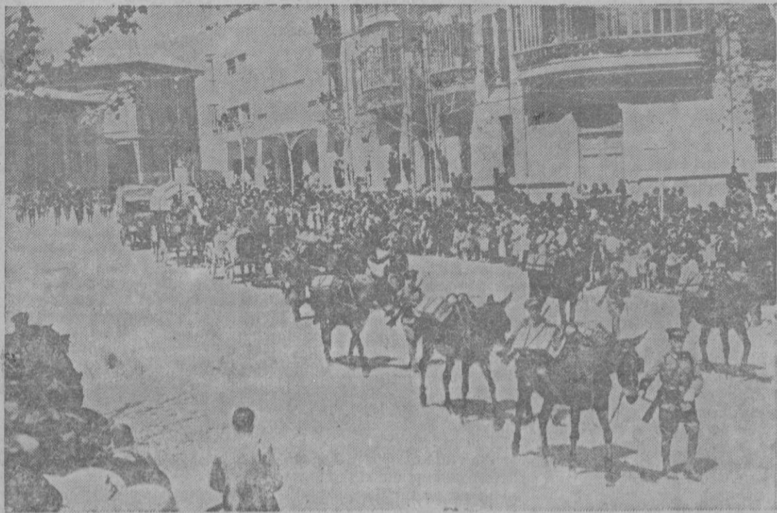
EL DESFILE MILITAR