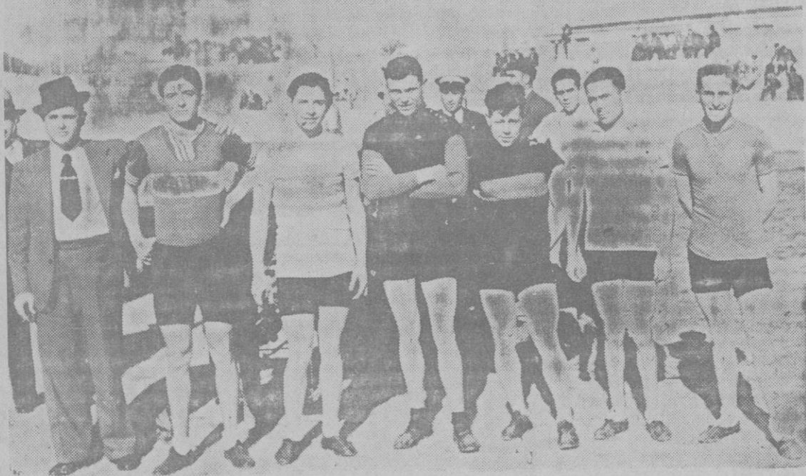
CICLISMO.—Los stayer que ayer disputaron las series eliminatorias del campeonato regional de medio fondo.