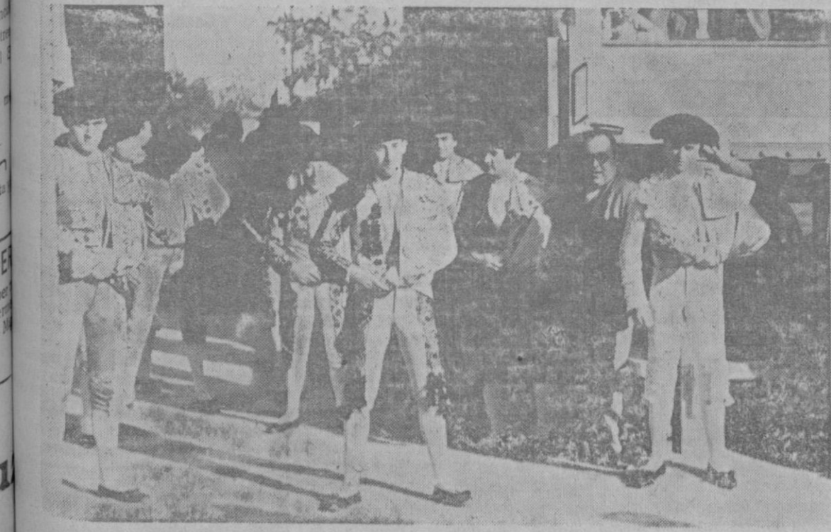
EL UNICO MOMENTO en que la novillada del domingo—véase sino la crónica de «Zeda», en segunda página—tuvo color de fiesta taurina: las cuadrillas disponiéndose al paseo. Lo demás, exceptuando la presencia de las «mises», fué malo, muy malo. Una tarde de plomo.

El número de nuestro teléfono es el 1745