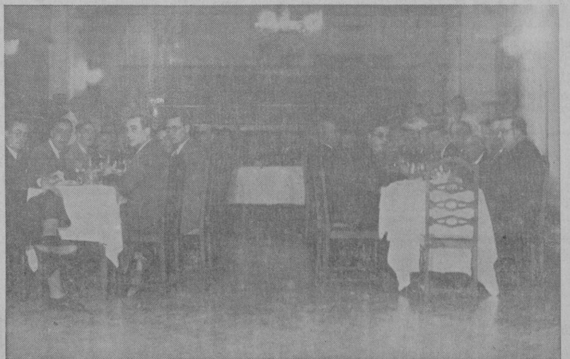
AJEDREZ.—Banquete organizado por el Club Ajedrez Mallorca, en honor del campeón mundial Dr. Alekhine.