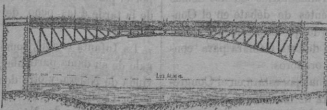
REDUCIDO DISEÑO DEL PUENTE