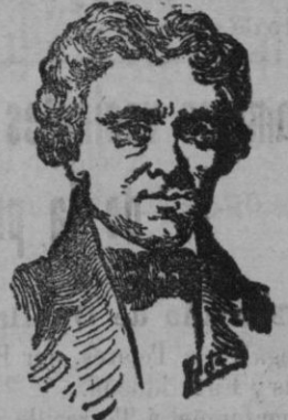
El 14 de Noviembre de 1830, cuando contaba 71 años de edad, D. Antonio Capmany bajó al sepulcro.

y como diputado de las famosas Cortes, en las que ganó celebridad de elocuente orador y de honrado patriota, muy especialmente con el discurso que pronunció pidiendo la abolición del Santo Oficio.