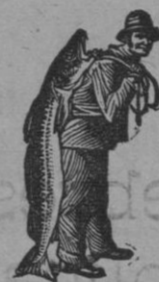
Obténase siempre la Emulsión con esta marca "El Pescador" marca del procedimiento Scott!

¡Ninguna otra emulsión, más que la de SCOTT, podía haber salvado á este niño, porque ninguna otra emulsión se compone de los mismos materiales puros y energéticos, ni gustan tanto al paladar del niño, ni se digieren con la misma facilidad por el estómago del niño. ¡Le conviene usar la emulsión que está probado que