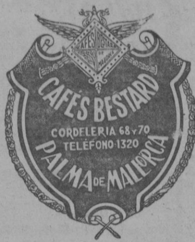
Nombre y marcas registradas

San Nicolás n.º 3 Vendemos a Precios Limitadísimos