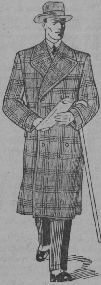
DE INTERÉS GENERAL