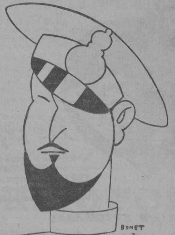
El general Balbo, jefe de las escuadrillas italianas, que han atravesado dos veces el Atlántico y ha sido nombrado recientemente, en su país, almirante del Aire.