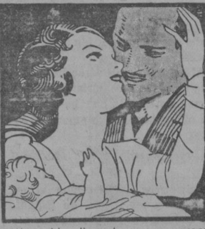
Mi marido dice ahora que pareceo más joven que en el día de mi boda, y creo realmente que me quiere más.

La Ciencia sabe ahora que la pérdida de Biocel en la piel es la causa de que las mujeres tengan arrugas y parezcan viejas. En cuanto los tejidos recuperan ese elemento vital, el cutis adquiere nueva y juvenil belleza. El verdadero Biocel se ha obtenido de Animales sumamente jóvenes, y lo contiene ahora la Crema Tokalon,