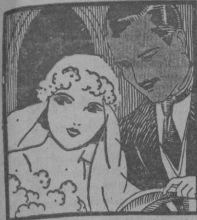
Mi marido dice que se enamoró de mí, en primer lugar, a causa de mi cutis deliciosamente suave, y del frescor de mi tez.