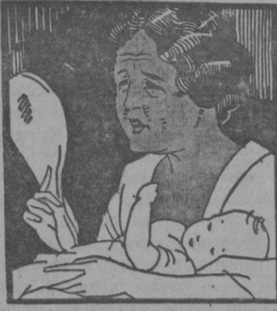
Pero, después del nacimiento de mi nene la zozobra y el cansancio grabaron en mi rostro las arrugas y las huellas de la edad.