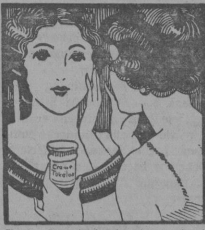
Finalmente, siguiendo el consejo de una amiga, probé un nuevo Alimento del cutis que contenía Biocel, lo que me procuró la mayor sorpresa de mi vida acerca de la belleza.