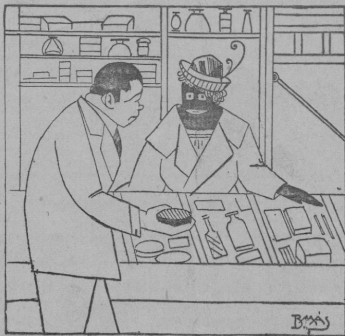
—Quería una caja de polvos, propios para mi cutis. —Tengo este betún que es insuperable.