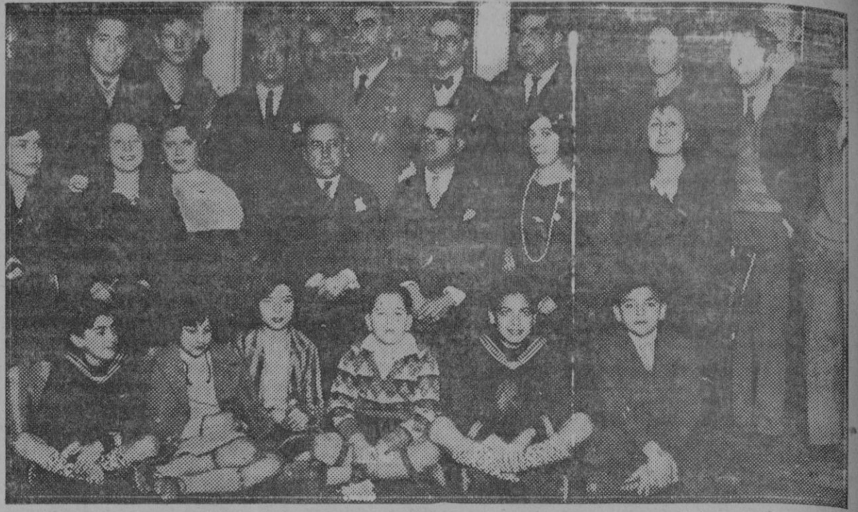
El cuadro artístico de La Casa de los Gatos ha celebrado con gran éxito su primera función teatral

El «Español» venció al «Arenas» por 4 a 0.