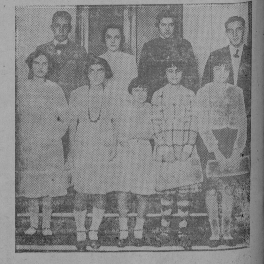
Alumnos premiados durante el reciente reparto de premios