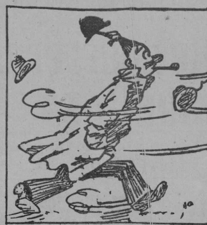
Un buen sistema para que no vuele el sombrero, durante este invierno.

esta misma génesis, vemos que los Estados Unidos, nación eminentemente industrial, es allí donde con más fuerza repercute el paro obligatorio: sufre 3.500.000; ¡el 22 por cien las Repúblicas centro y sudamericanas, naciones por excelencia agrícolas, se resienten muy poco o nada de tal problema. Claro es, que la organización y administración de una nación, también influirá en el número de parados; es una consecuencia que la razón nos la dicta. Muchas y variadas son las tesis y opiniones de reconocidos estadistas, para reducir o al menos mitigar tal problema, muchas que se han probado, muchas que han fracasado, y