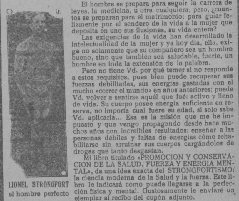
LIONEL STRONGFORT el hombre perfecto