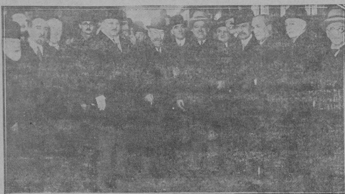
El presidente del Consejo de Ministros francés, Sr. Tardieu, y el ministro de Asuntos Exteriores, Sr. Briand, con los restantes miembros de la Delegación francesa en La Haya