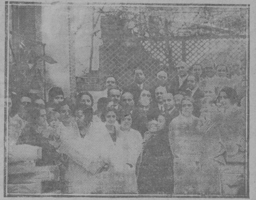
Reparto de equipos para recién nacidos. Los equipos fueron costeados por el Club Rotano de Madrid