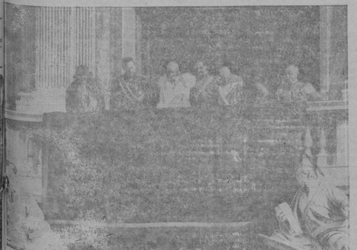
El Príncipe Humberto y la princesa María José, con los Reyes de Italia y Bélgica, saludando al pueblo desde uno de los balcones del Palacio del Quirinal.