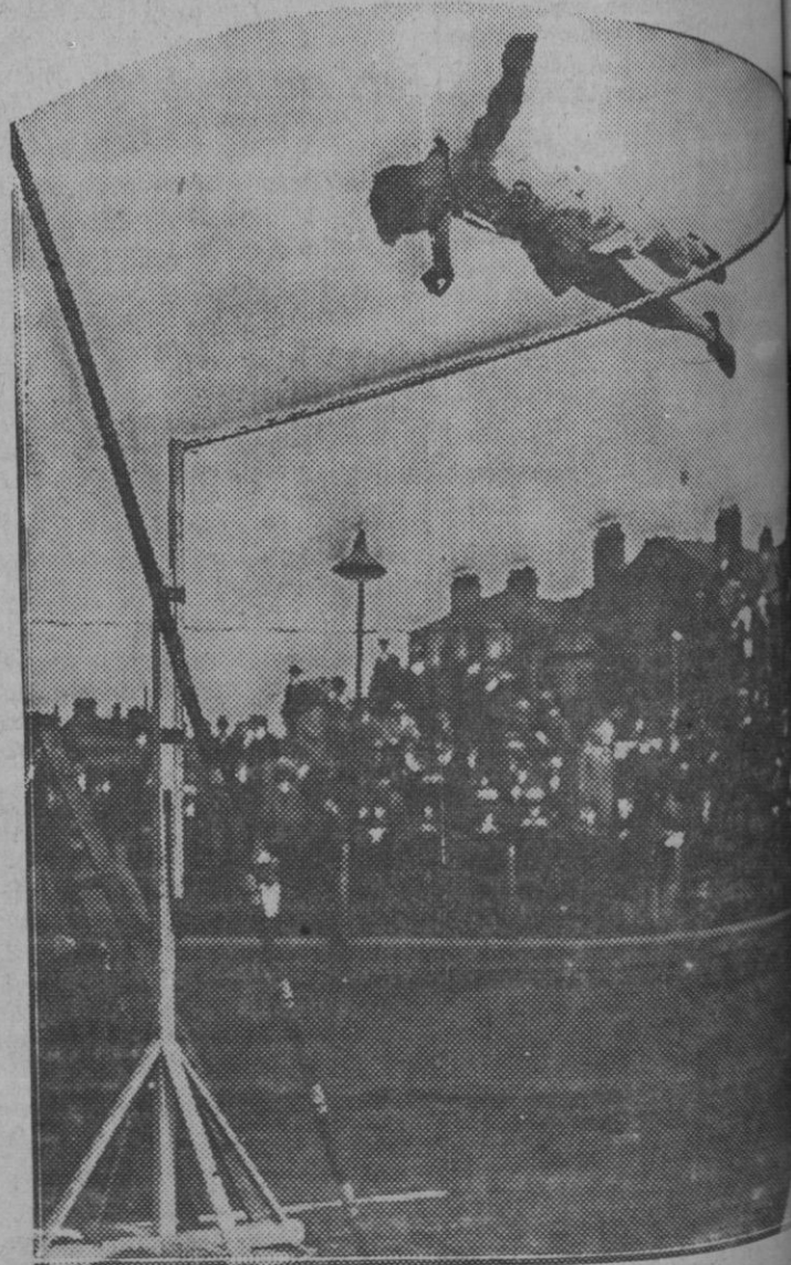
H. Ford, el famoso campeón de saltos con pértiga, en uno de los asombrosos que dió en las fiestas atléticas celebradas en St. Bridge (Inglaterra)

Revista Mensual Ilustrada Suscribese a ella: 6 pesetas al año. Escriba: GRANJA BARCINO-SELL.