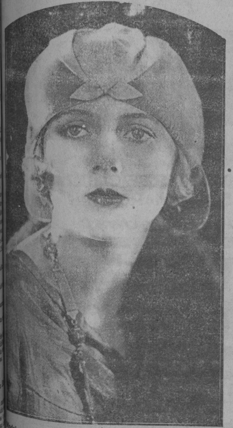
Modelo de gorrito—que semeja el casquete de los motoristas—de fieltro