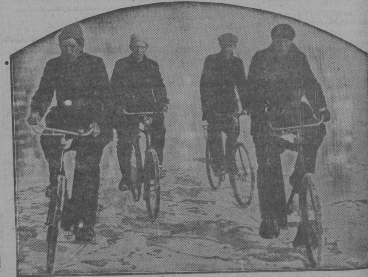
Interesante carrera ciclista celebrada sobre el canal de Zuyder Zee (Holanda), helado a causa de los intensos frios reinantes