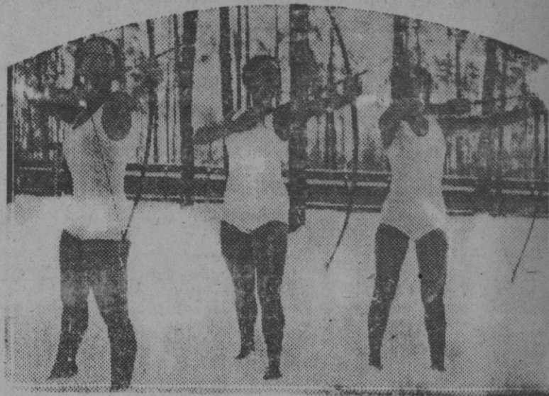
Tres bellas atletas alemanas de la Escuela Training, al aire libre, en Berlín, que participaron en el concurso de tiro con arco celebrado en los alrededores de la capital de Alemania

Paris 8.—La Conferencia de Reparaciones ha continuado la discusión referente a la creación del Ban-