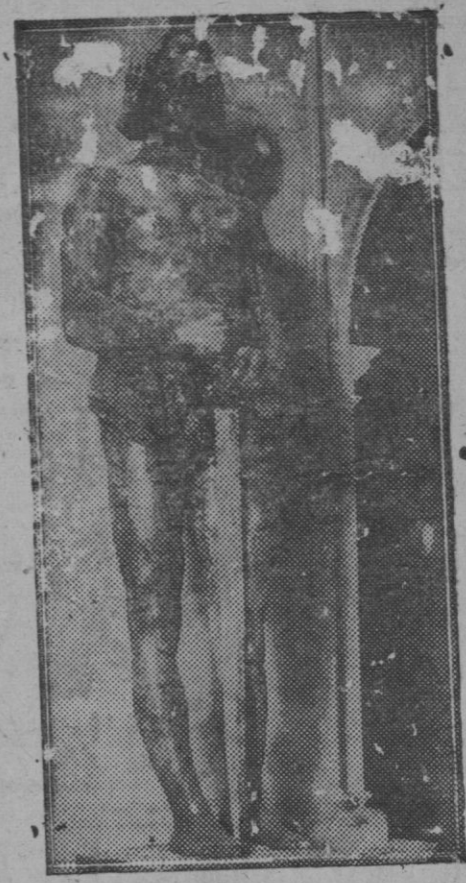
Barcelona: Escultura en yeso representando a San Jorge, original de Llimona, y que ha sido colocada en la escalera de honor de las Casas Consistoriales para en su día ser substituida por la reproducción en bronce