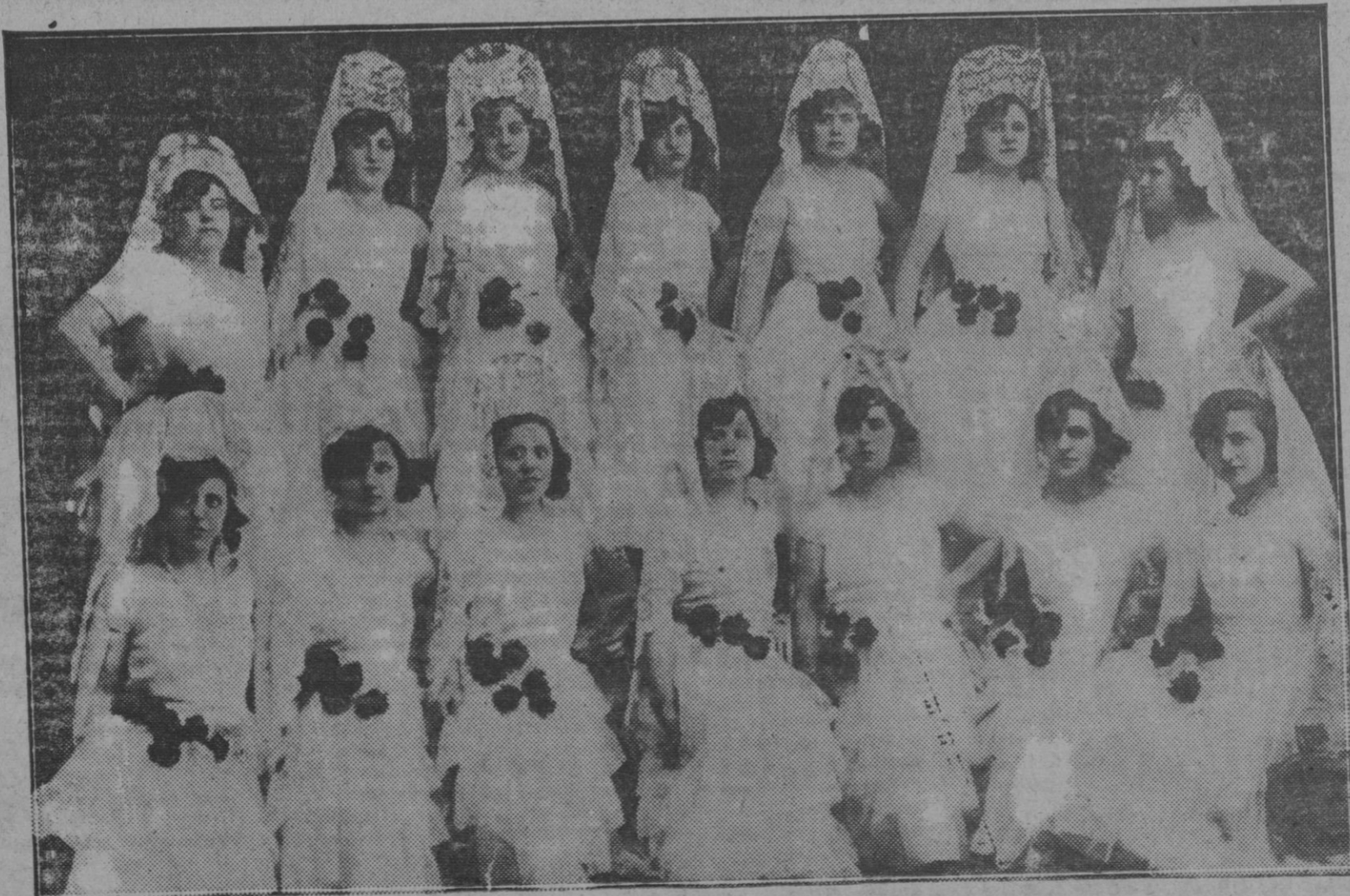
Distinguidas señoritas que cantaron el coro de los claveles de 'Los castigadores' en la velada a favor de los centros benéficos de nuestra ciudad